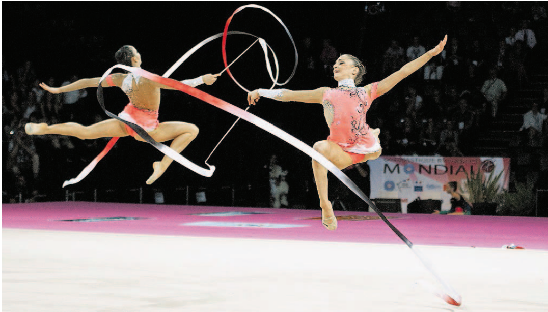
FINALE DI SPECIALITÀ Una splendida esibizione delle elvetiche con il cerchio e il nastro a Montpellier.