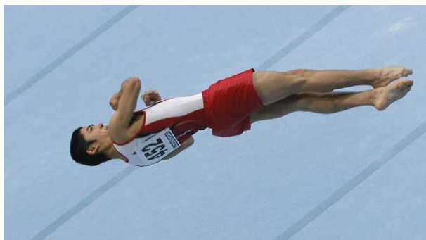
Spettacolo assicurato con Kenzo Shirai