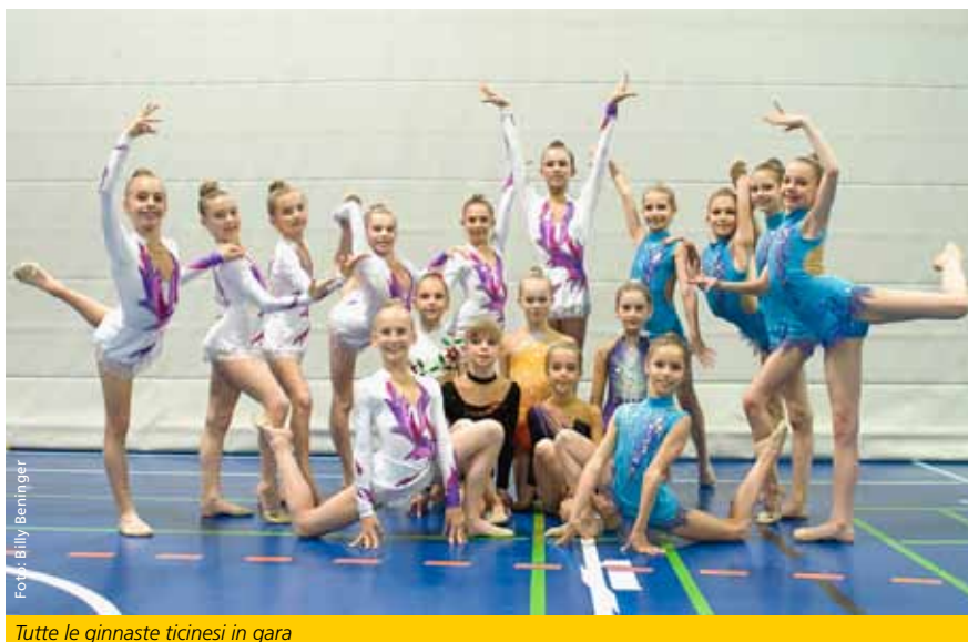
Tutte le ginnaste ticinesi in gara

Le classifiche complete possono essere consultate nel sito internet www.stv-fsg.ch